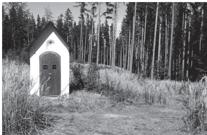
Kaplička pamatuje v poslední době několik Ebenových Truvéřských mší