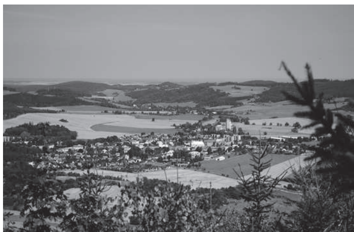
Úchvatné hřebenové pohledy na město a jeho okolí

Městský turistický okruh bude mít 5 základních stanovišť: Poutní hora - Hradiště Burkvíz - Linhartovský zámek – Rozhledna na Hraničním vrchu a Dubí vrch. V tomto 25 km dlouhém okruhu jsou dvě naučné stezky.