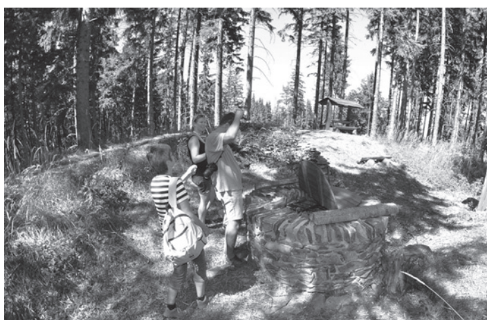
Na hradišti Burkvíz je stále co fotit

Když v roce 2010 proběhla u kapličky pod Poutní horou první Ebenova Truvéřská mše, začalo se mezi turisty nesměle mluvit o obnovení tzv. Křížové cesty, která by kopírovala více než 350letou náboženskou tradici. Jako příkladu bylo využito zkušeností při budování první naučné stezky Dubí vrch. Díky mimořádné iniciativě vedení LČR v M. Albrechticích je i turisticko – naučná stezka Poutní hora téměř hotova. Její počátek začíná u nového kříže nad koupalištěm, kde do roku 1977 stávala starobylá kaplička a tam také po 25 km končí.