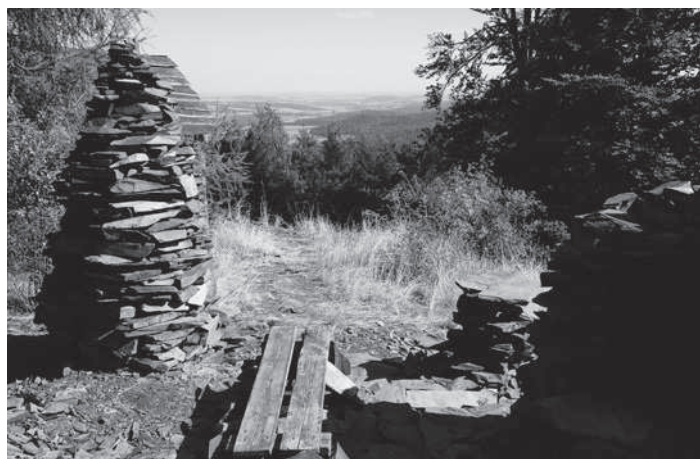
Poutní hora s břídlivým krbem, jehlanem a odpočívadlem

Druhá, nově budovaná turistická naučná stezka Poutní hora, návštěvníky hodně překvapí, a to nejen krásnými výhledy, ale hlavně bohatou historií. Vždyť kostel, který zde stával, byl dominantou tohoto kraje. Jeho rozměry byly úctyhodné 42 m x 18 m x 15 m a scházely se u něj generace obyvatel širokého okolí na svých poutích. Od toho je i název hory. Další zajímavosti, které na stezce najdeme, jsou starobylý buk s obvodem kmene přes 4 m, dále pak opravená kaplička, dvě jezírka, kamenný hrádek, ale především kouzelné pohledy na M. Albrechtice a jejich široké okolí, úpatí Jeseníků, Krnovsko, Opavsko a do části Polska. Nádherné výhledy dávají tomuto místu zvláštní náboj a nostalgickou atmosféru.